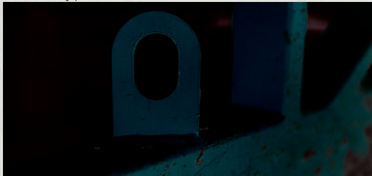
Vázací body pro snadnou manipulaci s plošinou.