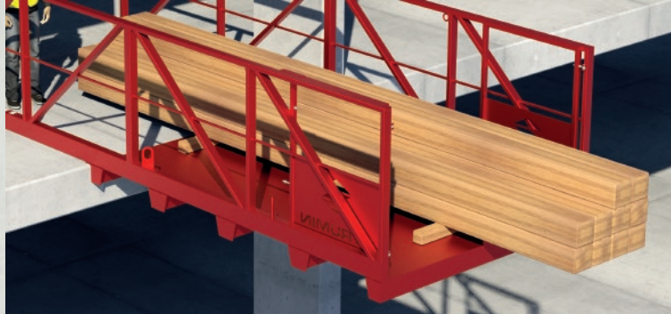
Otevírací přední část pro manipulaci s dlouhým materiálem.