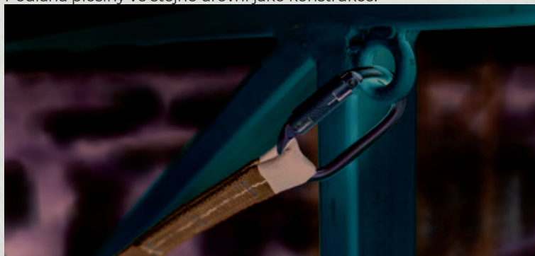
kotevní body pro OOPP