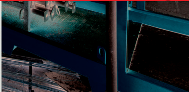
Podlaha plošiny ve stejné úrovni jako konstrukce.